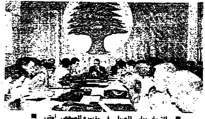
الشيخ بيار الجليل في مؤتمره الصحفي امس

العلاج الصحيح واضاف البيان: انطلاقاً من هذا المنطلق الجديد، نرى الهيئة الوطنية ان العلاج الصحيح يكمن في جميع القوى الوطنية المعتدلة من كافة التيارات التي كانت ضحية بريرة الاحداث في بيروت والى دعوة كل الحزاب والجمعيات والهيئات السياسية والاجتماعية العلمية والادبية الى ان تلتزم مع هذا الصف الوطني في اتحاد قوى الاعتدال الوسطي يكون نواة تجمع للقوة المعتدلة في البلاد. وقد باشر حزب الهيبة الوطنية في العمل لانشاء هذا التجمع والاتحاد كخطة للصلح الوطنية كصوباً وان الخطاب التي نادى بها الهيئة الوطنية والتي اعلنت الحكومة من الرئيسة في تنفيذ بعضها حالياً هي مطالب وطنية واجتماعية وليست مطالب طائفية.